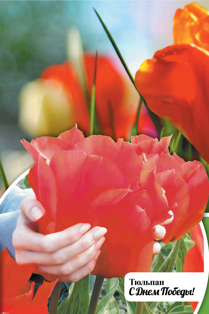
Тюльпан С Днём Победы!