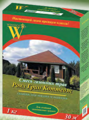
Роял Грин Коттедж