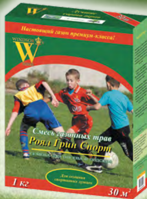
Роял Грин Спорт