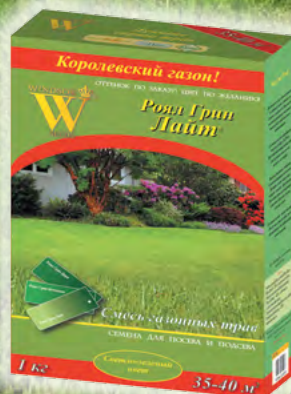
Роял Грин Лайт