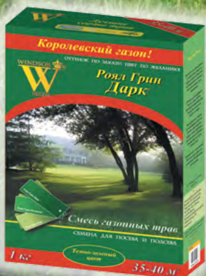
Роял Грин Дарк