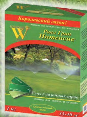
Роял Грин Интенсив